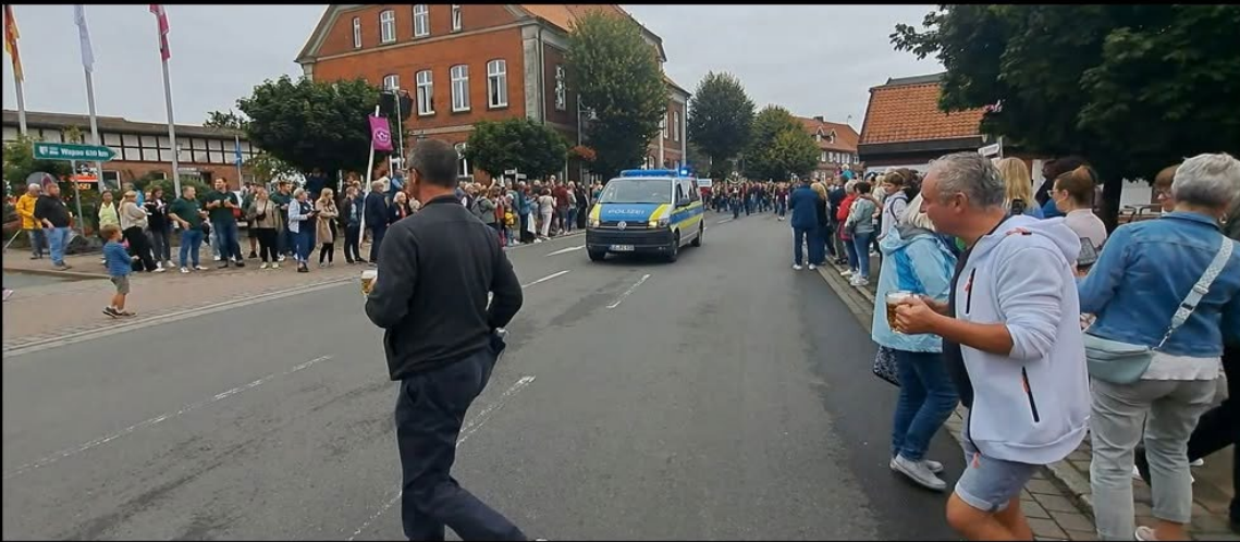
Heideblütenfestumzug in Amelinghausen am 18. August 2024

Wir waren mit der Kamera beim großen Heideblütenfest in Amelinghausen dabei und haben einen Film erstellt.