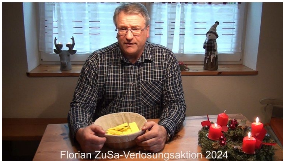
Florian ZuSa-Verlosungsaktion 2024