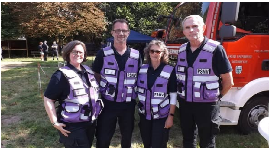
Foto: Team PSNV Landkreis Uelzen (Psychosoziale Notfallversorgung) nach dem Interview auf dem Kreisfeuerwehrtag in Kirchweyhe

www.florian-zusa.de/mp3/KFTKirchweyhe.mp4